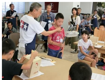
活動風景（作品発表会）