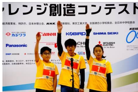
全国大会（選手宣誓）

一般来場者約650名の応援の下、予選・決勝及び作品紹介のプレゼンテーションが行われ熱気に溢れた大会となった。