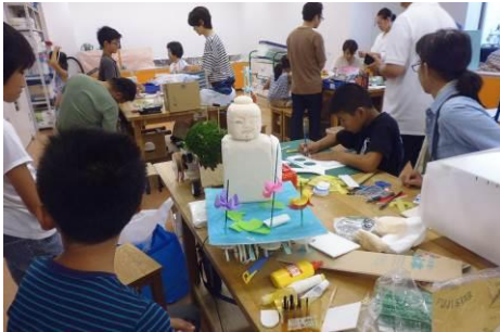
地区大会（創作指導会）

6月から9月の期間に全国78地区において地区大会が開催された。総勢664チームの青少年が「からくりパフォーマンスカー」を作成し競技に臨んだ。