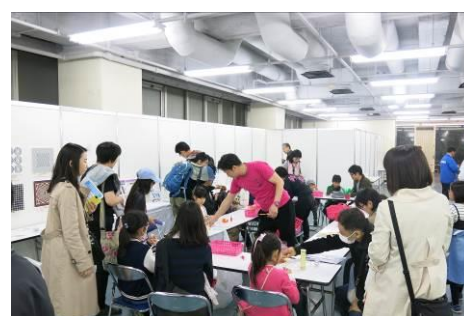
公開教室（全日本学生児童発明くふう展）