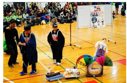
全国大会（競技風景）