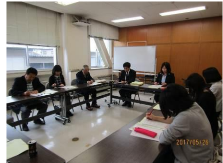
青森県合同研修会（5月26日）