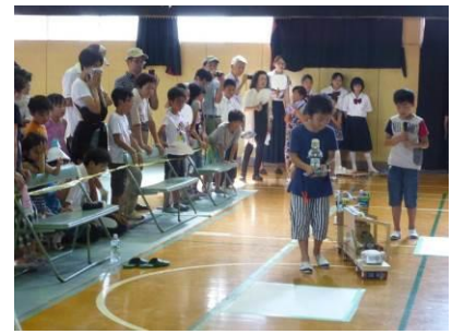
地区大会（地区コンテスト大会）