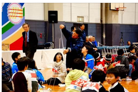
公開教室（チャレンジ創造コンテスト全国大会）