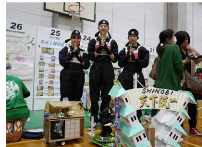
全国大会（チームブース風景）