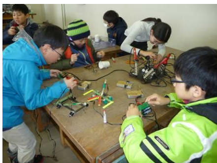
活動風景（電子工作）