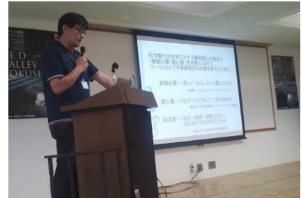
四国ブロック合同研修会（8月8日）