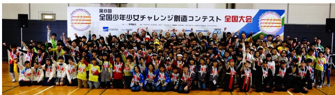
全国大会（出場全チームの記念撮影）