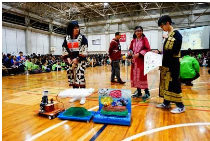
全国大会（競技風景）