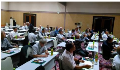
中国ブロック合同研修会（10月3日）