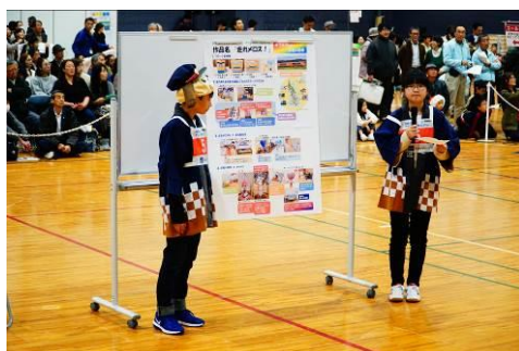
全国大会（作品プレゼンテーション）