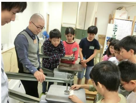
活動風景（木工工作）

地域を拠点として活動を行う 少年少女発明クラブ での知的創造体験活動を支援した。本年度、新たに1クラブ（神奈川県海老名市）が開設され全国で212クラブとなった。年間を通したクラブ員数は約9,200名で、延べ約6,500回の講座に参加し創作活動に励んだ。