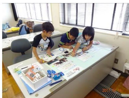
宮古市をPRする作品作り