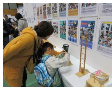
作品展示会（碧南市）