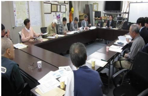
大阪府合同研修会（4月24日）