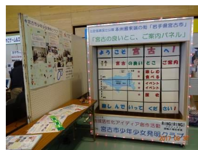
作品発表会（宮古市産業まつり）